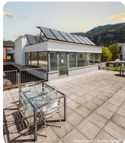
Dachterrasse / Rooftop Terrace