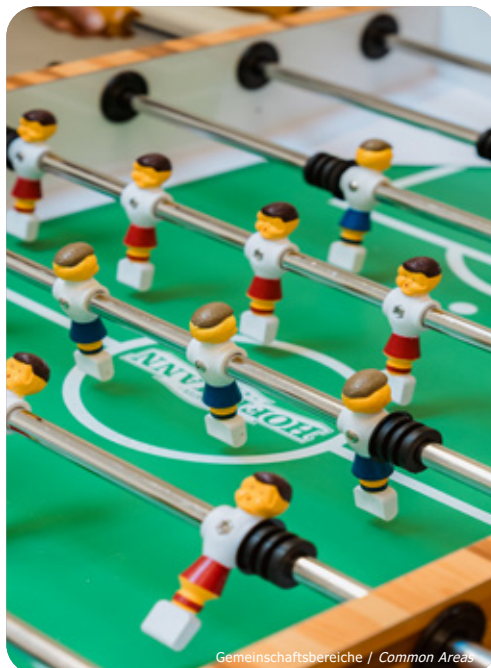
Gemeinschaftsbereiche / Common Areas