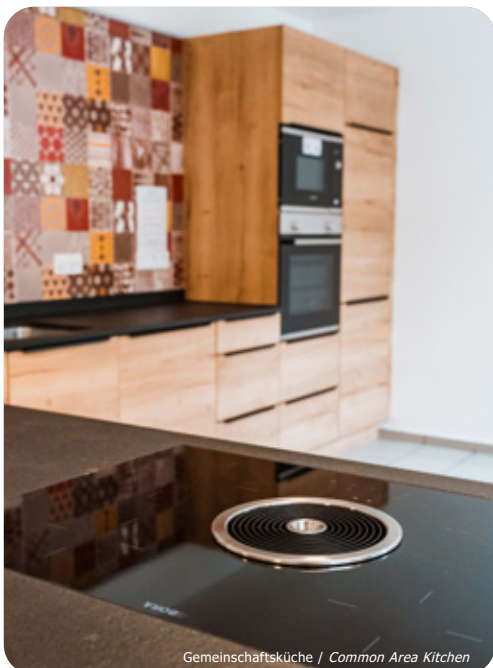
Gemeinschaftsküche / Common Area Kitchen